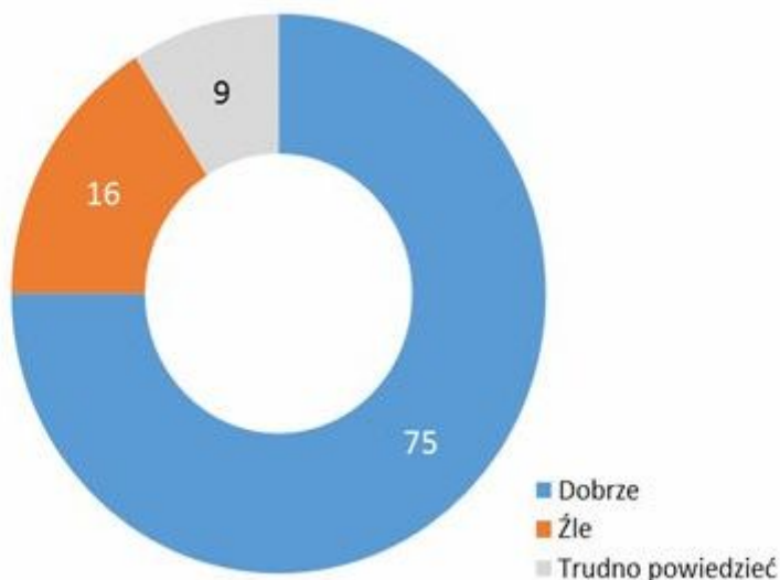
Wykres nr 1. Jak by Pan(i) ocenił(a) działalność Policji (%)