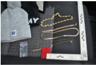
Odzyskana przez policjantów biżuteria